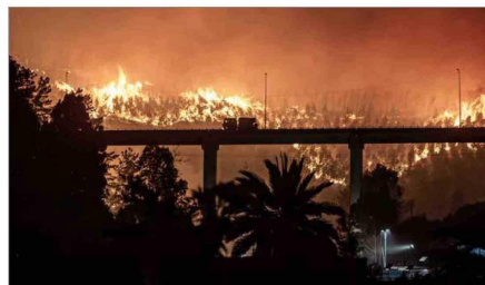
EN MÁS DE MIL SE ESTIMAN LAS VIVIENDAS DESTRUIDAS. — Un total de 19 muertos dejaban los incendios, que seguían activos en las regiones de Nuble y Biobío, mientras otras zonas del país también sufren este tipo de siniestros. La imagen corresponde a Penco.

“Hemos aprendido muy poco en la prevención de desastres y en la capacidad de enfrentar los vectores que originan los incendios. Hay una desplanificación regional”.