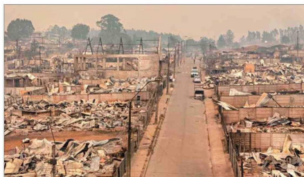
“TORMENTAS DE FUEGO.” — Este nuevo tipo de siniestros, con rápido avance a las ciudades, será cada vez más frecuente en el marco del cambio climático, dicen los expertos. En la imagen, Punta de Parra (comuna de Tomé, provincia de Concepción).