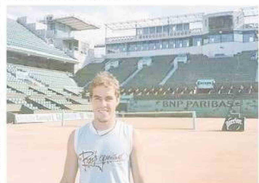
Registro en la cancha Philippe Chatrier de Roland Garros, Francia, en 2004, durante un viaje tenístico cuando era universitario.