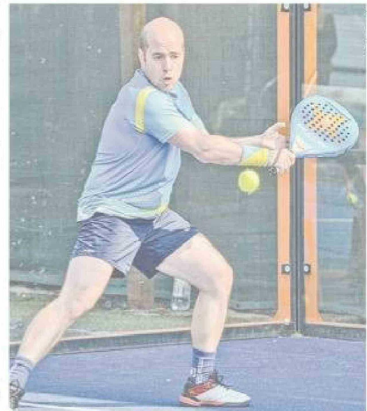
La autoridad deportiva también mantiene su vínculo con el deporte a través del pádel, disciplina que practica de manera activa a nivel regional y nacional.

Las actividades se desarrollan en distintos espacios, como gimnasios, recintos deportivos y juntas de vecinos, abarcando disciplinas como natación, yoga y baile entrenado. Para Roux, el deporte cumple un rol clave en la calidad de vida. "Quiero ser un seremi cercano, en terreno, que escuche a las organizaciones y que pueda aportar soluciones concretas", afirma. Finalmente, proyecta el sello de su gestión con claridad: "Me gustaría ser recordado como una persona cercana, que estuvo ahí y que logró hacer cosas por el deporte en la región".