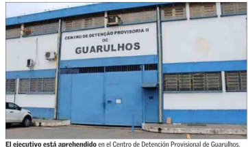
El ejecutivo está aprehendido en el Centro de Detención Provisional de Guarulhos.

Possible castigo "ejemplificador" Con todo, sobre el futuro de Naranjo en Brasil, el analista internacional y embajador considera que el chileno enfrenta un panorama "muy complicado", ya que "seguramente van a buscar que sea ejemplificador, que llame la atención, que termine con esto. Porque la ostentación en cómo lo hizo, con una premeditación enorme, como se le grabó, están las pruebas. No sé qué líneas defensiva van a tomar". Además, dice que argumentos que podría usar la defensa, como el consumo de alcohol u otras sustancias, podrían ser incluidos y considerados como agravantes. "Es una persona adulta, que tiene profesión y un puesto de interés. No se trata de alguien iletrado, esto es a conciencia, lo hizo buscando producir el daño que produjo".