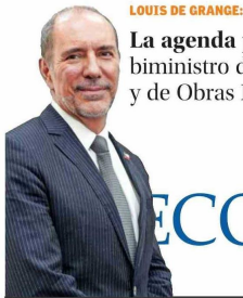
LOUIS DE GRANGE: La agenda portuaria del nuevo biministro de Transportes y de Obras Públicas B 5