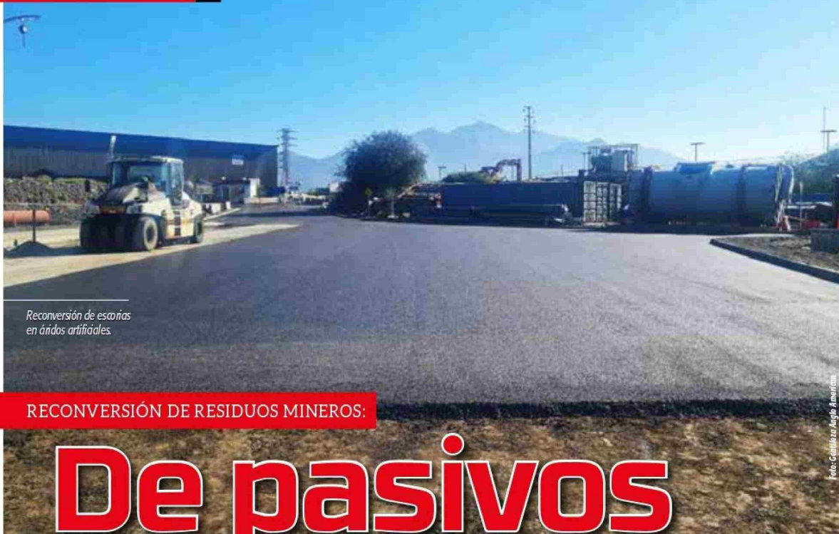
Reconversión de escorias en áridos artificiales.