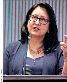
La contralora general de la República, Dorothy Pérez.

que ir a licitaciones vamos a perder un año y medio más", dice. Consultados por "El Mercurio" por el nuevo rechazo de la Contraloría a un contrato de litio, desde el Ministerio de Minería se remitieron a su declaración previa. "El rechazo por parte de la Contraloría General de la República de estos CEOL, ingresados por la administración anterior, justifi-