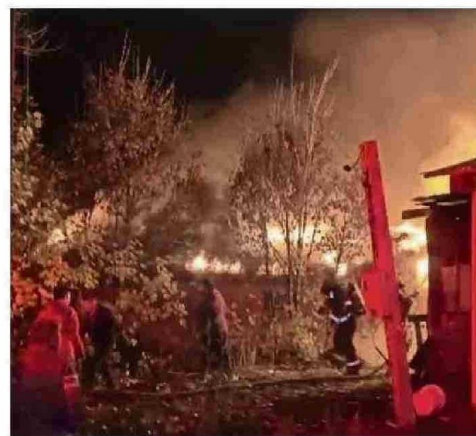
AÚN ESTABA OSCURO CUANDO COMENZÓ EL TRABAJO DE BOMBEROS.

El comandante de Bomberos precisó que la investigación sobre el origen y causa del siniestro permanece abierta. Un equipo del Departamento de Estudios Técnicos, probablemente derivado desde Temuco, se hará cargo de los peritajes, por lo que la remoción de escombros quedó suspendida hasta nuevo aviso o hasta que el análisis respectivo sea llevado a cabo por los expertos de la institución.