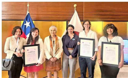
Entrega de premios del "Concurso Nacional de MANGA sobre No Violencia en Chile".

En esta misma línea, que recoge el alto impacto del manga en los jóvenes, el ministerio de la Mujer y Equidad de Género de Chile, junto a la embajada del Japón, lanzaron en 2024 el "Concurso Nacional de MANGA sobre No Violencia en Chile" en el que participaron jóvenes de distintas regiones. En la ocasión las tres obras ganadoras