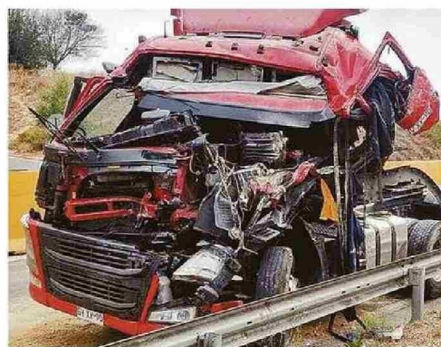
LOS DAÑOS AFECTARON MAYORMENTE AL LADO DEL CONDUCTOR.

concesionarias provistas por el Ministerio de Obras Públicas (MOP), las que se sumaron a los esfuerzos de orden que implicaron la coordinación entre camiones y grúas.