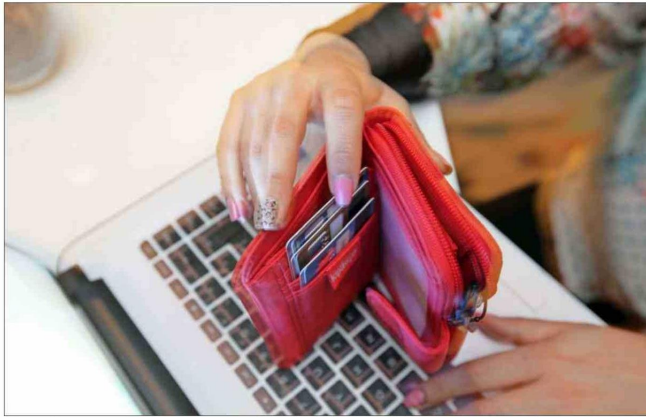
El interés que se cobra por usar tarjetas de crédito es el factor más relevante en el promedio mensual.

La presión crece en los distintos préstamos de consumo. La inflación es una de las mayores responsables, según expertos.