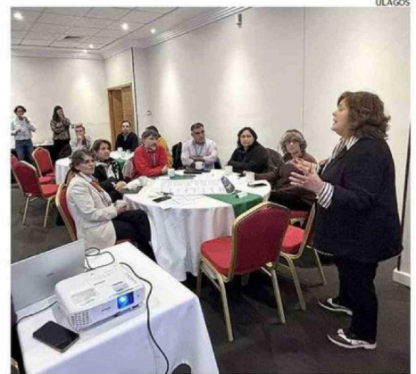
HUBO GRAN CONVOCATORIA DURANTE LA JORNADA DE TRABAJO.