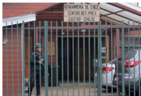
TRAS LA AUDIENCIA, EL JOVEN FUE DERIVADO A LA CÁRCEL LOCAL.

"Mi representado fue agredido por el hijo de la