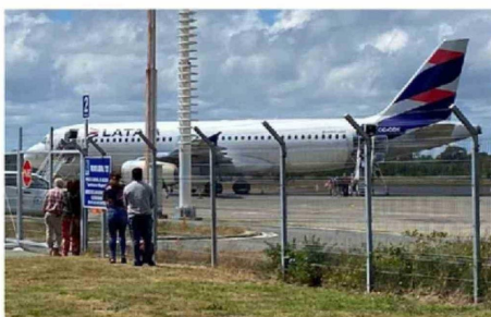
SE PROYECTAN DOS MANGAS DE ACCESO EN LA INICIATIVA.