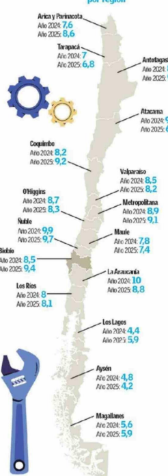
Tasa de desocupación por región

Por Nicolás Arrau Álvarez nicolas.avares@diariobiosand