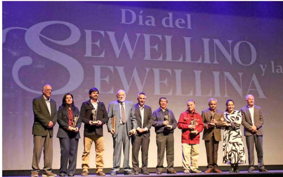
Durante la ceremonia se reconoció a destacados Sewellinos y Sewellinas por su contribución a la preservación de la memoria histórica de Sewell.