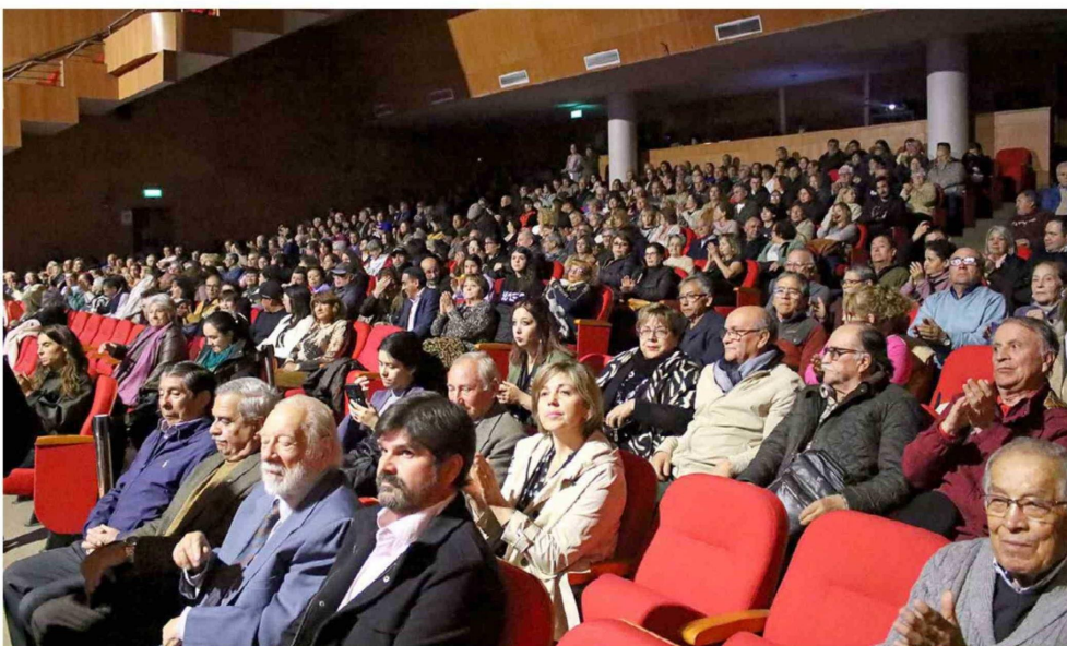
La comunidad sewellina se reunió en el Teatro Regional Lucho Gatica para conmemorar el Día Nacional del Sewellino y la Sewellina en una emotiva ceremonia llena de recuerdos y homenajes.