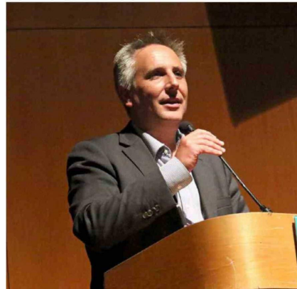
El alcalde de Rancagua, Raimundo Agliati, valoró el aporte de la comunidad sewellina en la construcción de la identidad patrimonial de la región.