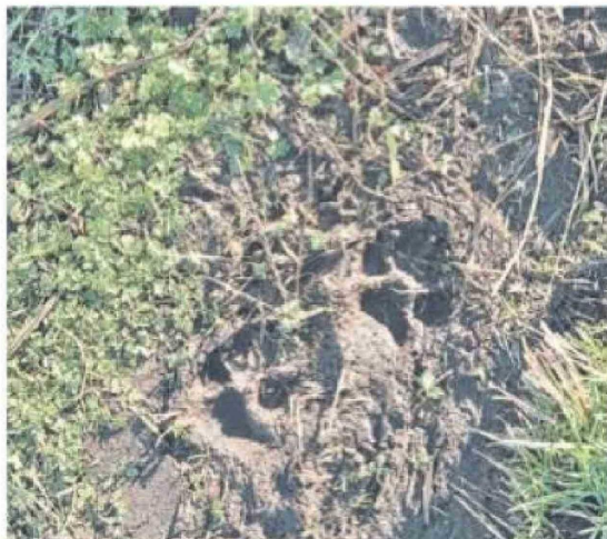
Huella de puma encontrada en la zona.