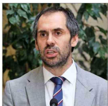
Nicolás Grau, ministro de Hacienda.

Para atenuar ese escenario, el Gobierno apuesta a recibir el pago de dividendos de empresas públicas. Expertos advierten que esos aportes serían acotados frente al desafío.