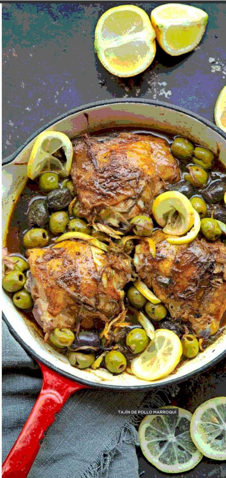
TAJÍN DE POLLO MARROQUÍ