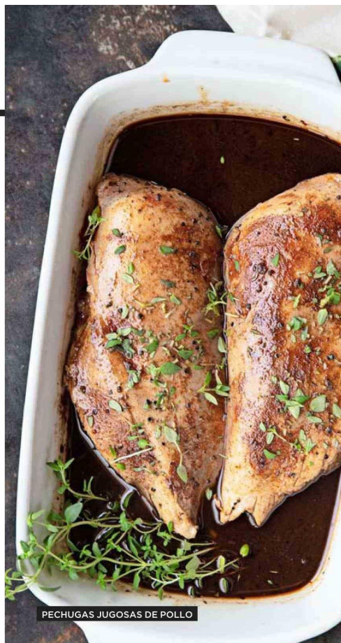
PECHUGAS JUGOSAS DE POLLO

AL ESTILO INDIO (TIKKA MASALA), TAJÍN MARROQUÍ AL SARTÉN, CON CERVEZA Y MIEL O PESTO Y ALMENDRAS SON LAS PROPUESTAS DE ÁNGELES ÁLAMOS PARA TRANSFORMAR EL POLLO EN UN PLATO ESTRELLA.