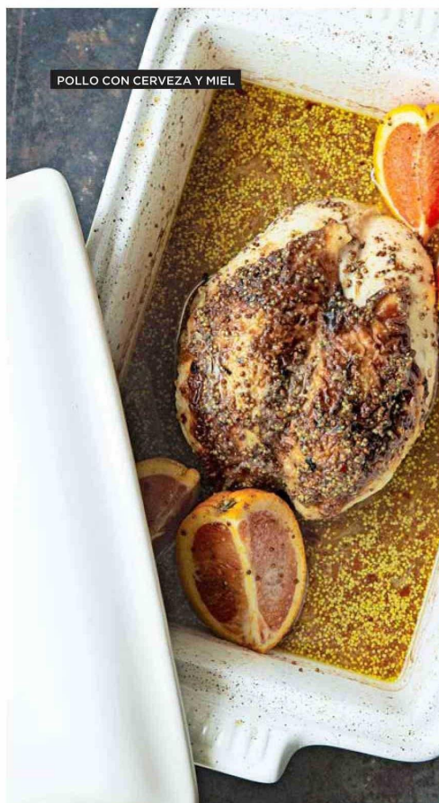
POLLO CON CERVEZA Y MIEL