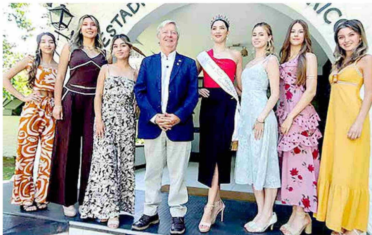
Ayer se dieron a conocer oficialmente las seis candidatas a reina de la Vendimia Curicó 2026.

El proceso de elección de las candidatas se inició con la apertura de postulacio-