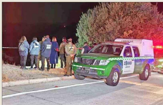
La fiscalía y el OS9 de Carabineros quedaron a cargo del caso, en la cuestra Zapata.

Seis cuerpos fueron recuperados desde la cuestra Barriga en abril del año pasado. El hecho marcó el inicio del frecuente abandono de víctimas de homicidio en esa zona, en el marco del crimen organizado.