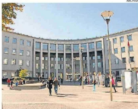
ERROR FUE DETECTADO EN EL 7° JUZGADO CIVIL DE CONCEPCIÓN.