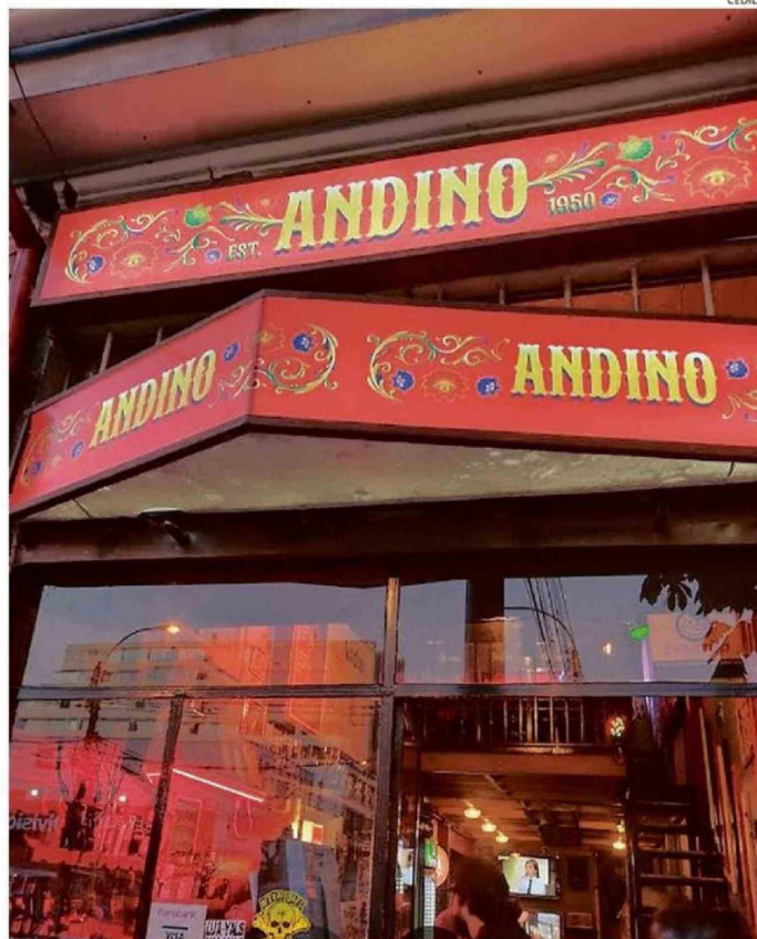
AUNQUE EN SUS PRIMEROS AÑOS FUNCIONÓ EN OTRO LOCAL DE LA MISMA CALLE, EL ANDINO SE EMPLAZA EN VON SCHROEDERS #94.