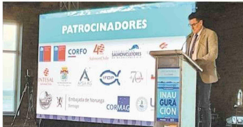
El subsecretario de Pesca, Osvaldo Urrutia, estuvo presente en el AquaForum Patagonia en Puerto Natales.

Pero el anuncio de mayor impacto político fue el que concierne a la Ley Lafkenche -que regula los Espacios Costeros Marinos de Pueblos Originarios- cuya aplicación, a juicio del subsecretario, se ha convertido en un obstáculo para múltiples actividades legítimas en el borde costero, incluyendo la acuicultura, la pesca artesanal, el turismo y las actividades portuarias. El gobierno prepara indicaciones a una moción parlamentaria actualmente en el Senado, con miras a presentarlas entre fines de junio y comienzos de julio.