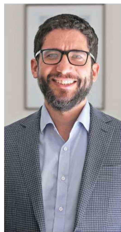
Giorgio Boccardo, ministro del Trabajo.