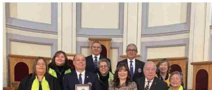
La Iglesia de