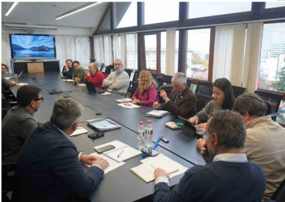
LOS CONSEJEROS REGIONALES ASUMIERON UN ROL DE INTERLOCUTORES PARA ASEGURAR QUE COLBÚN CUMPLA CON EL FALLO DEL TRIBUNAL AMBIENTAL.

fijada como condición provisional. Según la empresa, ese nivel se ha mantenido de forma efectiva desde junio de 2025.