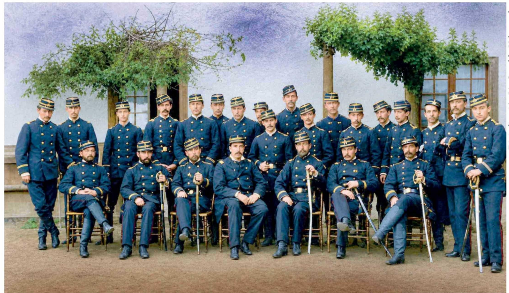
Oficialidad del Batallón Talca en 1880.

de mayo de 1742, la Villa San Agustín de Talca no tuvo una guarnición militar estable. Solo ocasionalmente se formaban milicias para enfrentar determinadas situaciones: Guerra de la Independencia, Guerra contra la Confederación Perú-Boliviana, Revolución de 1851, Guerra con España, a modo de ejemplo. Sin embargo, al finalizar la Guerra del Pacífico y disolverse el afamado Batallón Cívico Movilizado Talca -que había sido creado mediante Decreto Supremo N° 37 del 6 de marzo de 1880- la urbe volvió a quedar sin un regimiento. Entonces,