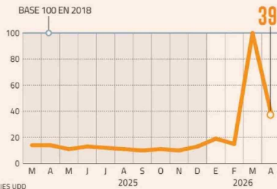
INTERÉS POR PRECIOS DE BENCINAS SE DISPARARON DURANTE EL MES