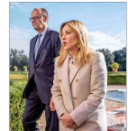
"Merzoni": el nuevo eje Berlín-Roma, con una relación que se ha estrechado en las últimas semanas y preocupa a Francia. | A 5