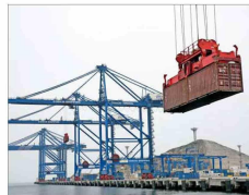
Fallo del Primer Juzgado Constitucional de Lima resolvió acotar la supervisión gubernamental en el terminal.

EE.UU. arremete contra Beijing: Disputa que enfrenta a Perú con operadores chinos en Chancay pone en alerta a industria portuaria nacional sobre los contratos futuros