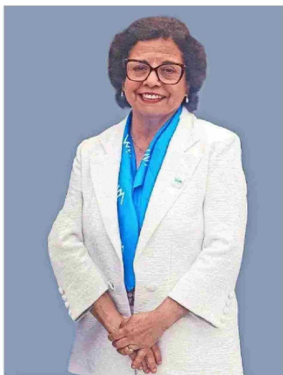
Aurora Williams B., ministra de Minería y presidenta honoraria de Expomin 2025.

El evento permite consolidar la cadena de valor que dará sustento a la mayor cartera de inversión proyectada en los últimos 10 años, según datos de Cochilco.