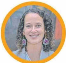
Carolina Tapia, seremi de las Culturas Lic. en Artes Plásticas UdeC