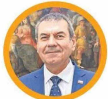
Anselmo Villagra, seremi de Vivienda y Urbanismo constructor civil