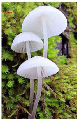
Hongos en sendero Siempreverde.

AUNQUE ESTE AÑO HAN DEMORADO UN POCO MÁS EN LLEGAR, LOS FOTOGÉNICOS COLORES DEL OTOÑO YA SE ESTÁN COMENZANDO A VER EN LA CORDILLERA DEL MAULE. UN BUEN LUGAR PARA COMPROBARLO ES EL PARQUE TRICAHUE, QUE TIENE VARIOS SENDEROS PARA HACER POR EL DÍA Y QUE AHORA TAMBIÉN CUENTA CON UN CAMPING CON BUENAS INSTALACIONES PARA LOS QUE QUIERAN QUEDARSE. Por Sebastián Montalva W.