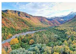
Vista desde la Meseta del Alto.