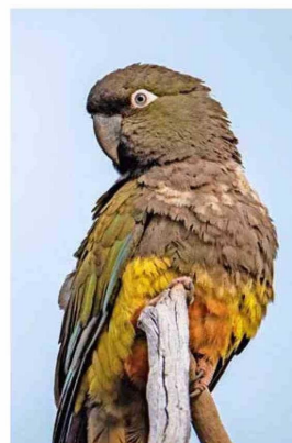
Aquí es fácil ver al loro trichahue.