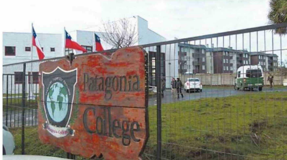
HACE SIETE AÑOS SE REGISTRÓ UN GRAVE EPISODIO DE VIOLENCIA ESCOLAR EN EL PATAGONIA COLLEGE DE LA CAPITAL REGIONAL.

En Puerto Montt, el Daem implementó el programa "Comunidades Libres de Violencia" en sus 75 establecimientos, también en respuesta a los hechos ocurridos en Calama. El