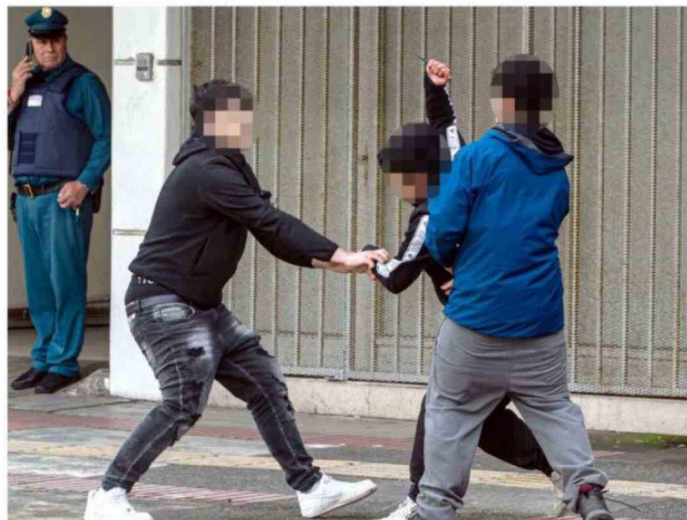
ESTA ESCENA OCURRIÓ EN EL CENTRO DE PUERTO MONTT HACE ALGUNOS MESES.

Sentencia que "lo relevante no es si hay más episodios o si son más graves, sino comprender que estos reflejan un quiebre en el respeto mutuo. Cuando los estudiantes no se sienten vistos, escuchados o legitimados, aparece la violencia. Por tanto, el problema central no es la cantidad de violencia, sino la calidad de las relaciones que la escuela está generando".