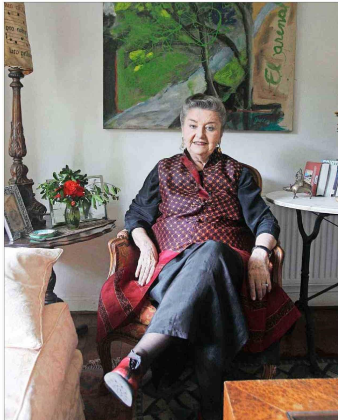
Marta Blanco también publicó las novelas "Mar adentro" (1997), "La emperrada" (2001), "Memoria de ballenas" (2009) y "El peso del corazón" (2015), y los libros de cuentos "Todo es mentira" (1974) y "Para la mano izquierda" (1990).

lencio de los inviernos". Para Del Río, la novela no es una historia de amor, sino "una historia del célebre y ominoso proceso del amor visto desde alguien que no se cuenta cuentos y que tiene conciencia del ácido e insobornable transcurso hacia la muerte".