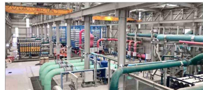
$16.468 millones Serían las pérdidas de Econssa durante este año.