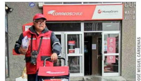
3.757 trabajadores Tenía correos al cierre del año pasado.

En la ley miscelánea que ingresó el gobierno anterior a fin de año —duramente cuestionada por los llamados “amarres”— se propina ampliar el giro de Correos de Chile, permitiéndole hacer labores de logística por medios físicos, digitales o híbridos. El 14 de enero esa norma fue rechazada.