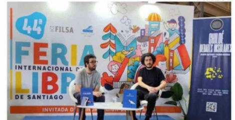
LOS EDITORES ESTUVIERON EN LA ÚLTIMA FERIA INTERNACIONAL DEL LIBRO DE SANTIAGO (FILSA), EN DICIEMBRE DEL AÑO PASADO.