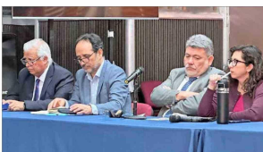
Los parlamentarios de oposición alertaron sobre el mayor costo para las familias que han tenido por los alzas de los combustibles.

Mientras el Gobierno se apronta al diálogo, las pymes alertan sobre los costos del reajuste salarial en el empleo formal.