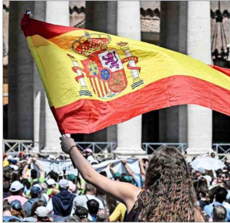
UNA JOVEN española asiste a la oración del Regina Coeli en el Vaticano.

Los datos de esta última fueron, a su vez, aún más reveladores al marcar un repunte de 14 puntos porcentuales entre los jóvenes que se identifican como católicos, en momentos en que un 38,4% de las personas de entre 15 y 29 años en España considera la religión como un aspecto "muy o bastante importante" en sus vidas, una cifra récord en la