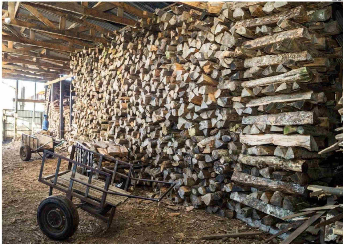
EL PLAN BUSCA RESTRINGIR EL USO DE ARTEFACTOS CONTAMINANTES, PROMOViendo EL USO DE LEÑA SECA ENTRE LOS HABITANTES DE LA REGIÓN.

Por lo anterior, el experto señala que es fundamental normar el uso de la leña, pero junto con ello, el uso de los calefactores, ya que estos también deben ser los adecuados para una correcta combustión.