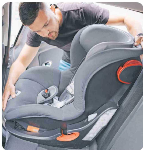
En Chile el uso de la silla de retención infantil del auto apenas llega al 33% y la mayoría lo hace de manera incorrecta.

➔ Pese a la insistencia y recomendaciones entregadas, muchos padres no toman aún la precaución necesaria para garantizar la seguridad de los niños en los vehículos con adecuados sistemas de retención infantil. De hecho, ésta es la principal causa de muerte en el mundo de niños entre 5 a 15 años, por lo cual, debemos protegerlos del riesgo cotidiano y diario que tiene el transporte en automóviles.