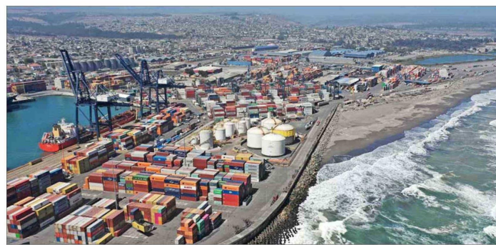
ESTADOS UNIDOS es el segundo mayor socio comercial de Chile, tras China.

En esta versión se les preguntó cuál era su grado de acuerdo con respecto a si Chile está preparado para mitigar el impacto de un aumento arancelario sobre sus exportaciones, lo que causó reacciones diversas. Un 31,37% de los especialistas consultados se mostró en desacuerdo con la premisa,