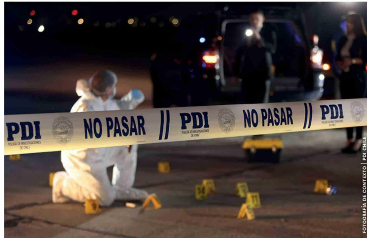
FOTOGRAFÍA DE CONTEXTO | PDI CHILE

Día del Autismo: Los Ángeles tendrá feria, marcha del silencio y primera plaza inclusiva en 2026