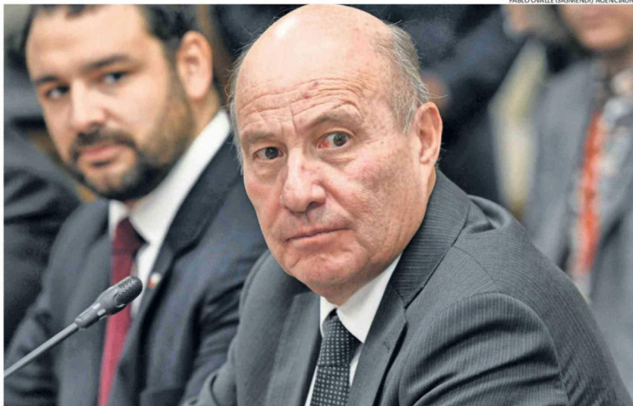
QUIROZ ASEGURÓ QUE LA SITUACIÓN FISCAL ESTÁ “DETERIORADA”, PERO NO EN QUIEBRA, ALGO EN LO QUE COINCIDIERON OTROS MINISTROS.