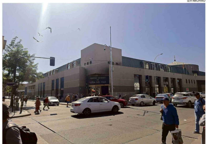
EL PUNTO DE IDA Y LLEGADA DE LA CIUDAD JARDÍN PERMANECE BAJO LUPA POR LA INSEGURIDAD.

2 veces ha fracasado el concurso público para la contratación de guardias tácticos en el terminal de Viña del Mar.