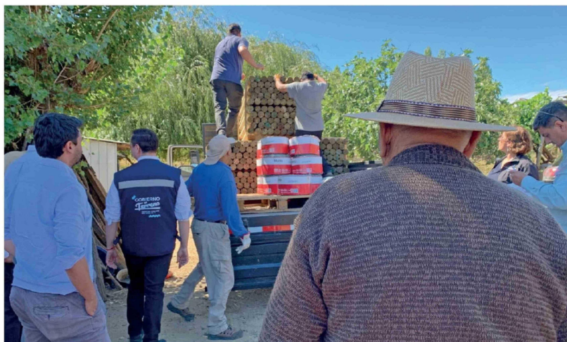
LOS AGRICULTORES DE LAJA comenzaron a recibir los primeros apoyos productivos tras el incendio "Rucalhue Sur" que arrasó entre 4.100 y 4.300 hectáreas.

Tras el siniestro "Rucalhue Sur", que dañó 14 casas, el Gobierno desplegó durante este lunes ayudas consistentes en forraje, polines y dinero en efectivo para los vecinos del sector Chorrillos. La acción tuvo lugar solo un día después de la entrega de los primeros hogares provisorios en el sector.