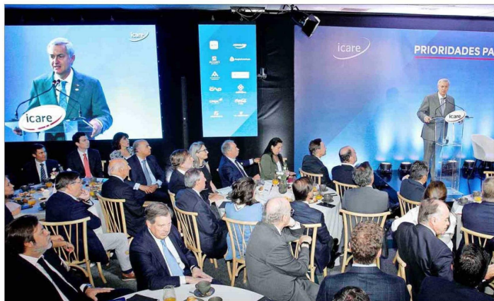
En el evento "Prioridades para Chile en la voz del Presidente electo", José Antonio Kast destacó el papel del sector privado en la economía.

El mandatario se presentó en Icare y planteó medidas proinversión. Pero también solicitó pagar a tiempo.