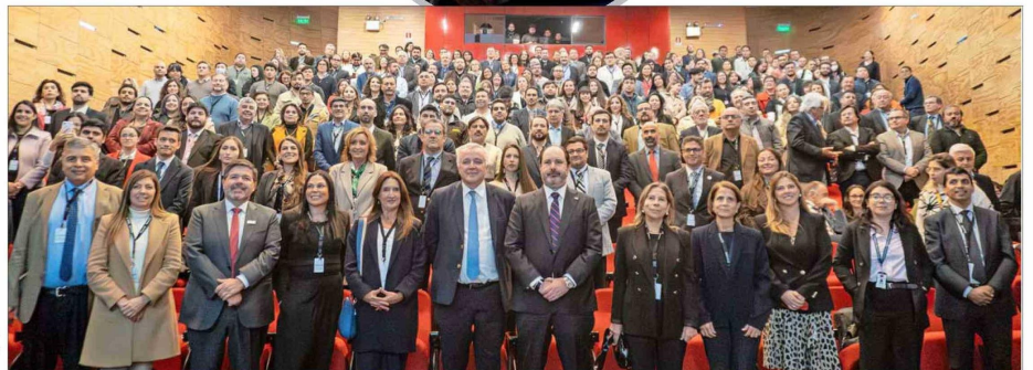
Público del encuentro en la sede Valparaíso de Duoc UC.

En la sede Valparaíso de Duoc UC se realizó el encuentro "Perspectivas y Reactivación del Mercado Laboral", instancia que reunió a autoridades, representantes del mundo productivo y la academia para abordar el escenario actual del empleo en Chile. La actividad contó con la participación del ministro del Trabajo y Previsión Social, Tomás Rau, quien presentó el diagnóstico del mercado laboral y las principales medidas orientadas a incentivar la inversión y la contratación. El encuentro permitió generar un espacio de diálogo sobre los desafíos para impulsar el crecimiento económico y fortalecer la generación de empleo, relevando el rol de la formación técnico-profesional en la preparación de capital humano pertinente.