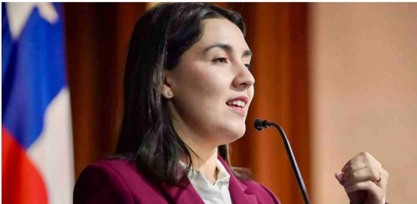
► Judith Marín, ministra de la Mujer y Equidad de Género.