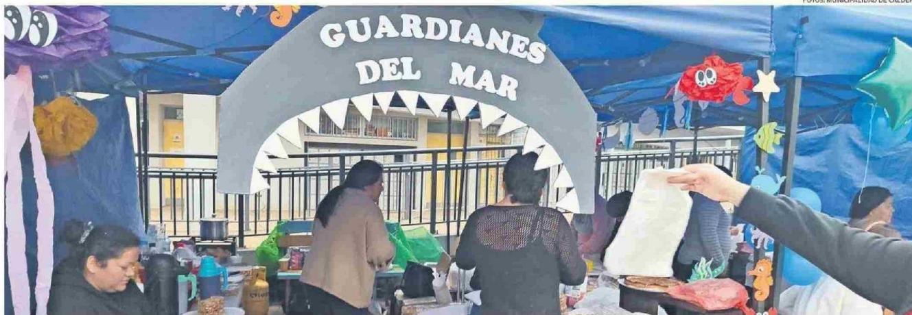
LA ACTIVIDAD SE REALIZÓ EN EL MARCO DE LOS INSTANCIAS PREPARADAS PARA DAR CIERRE AL MES DE MAYO.