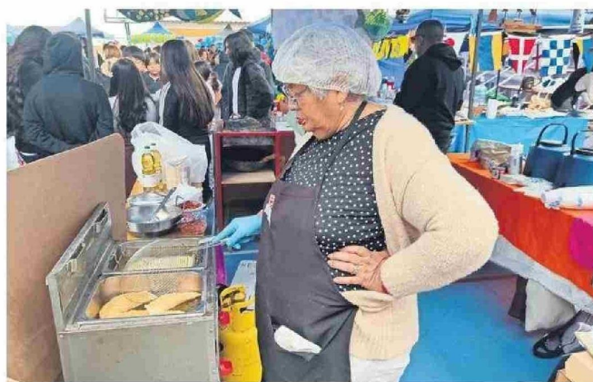
PARTICIPARON DIFERENTES ESTABLECIMIENTOS EDUCACIONALES DE LA COMUNA PUERTO.