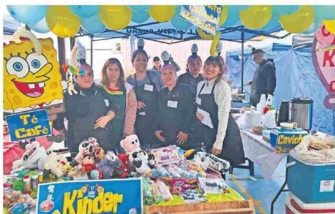
EN EL LUGAR TAMBIÉN SE EFECTUARON DEGUSTACIONES.