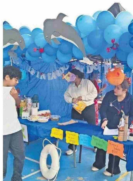
EQUIPOS DOCENTES TAMBIÉN PARTICIPARON.

Esta iniciativa no habría sido posible sin el valioso apoyo de las apoderadas, apoderados, equipo docente y asistentes, quienes demostraron su compromiso y dedicación para con los estudiantes, esta muestra gastronómica no solo permitió a la comunidad educativa disfrutar de los sabores del mar, sino también celebrar la riqueza cultural con presentaciones artísticas de sus alumnos y alumnas, promoviendo la integración y el aprendizaje en la comunidad escolar.