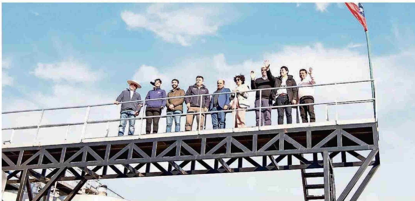
EL ALCALDE DE QUILLÓN, FELIPE CATALÁN VENEGAS, DESTACÓ EL IMPACTO DE ESTA ALIANZA PARA LA COMUNA.