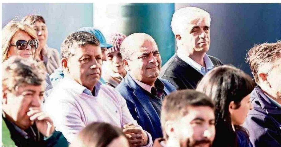
LA COOPERATIVA ESPERA ESCALAR EN COMPETITIVIDAD, INNOVACIÓN Y PRESENCIA EN NUEVOS MERCADOS.